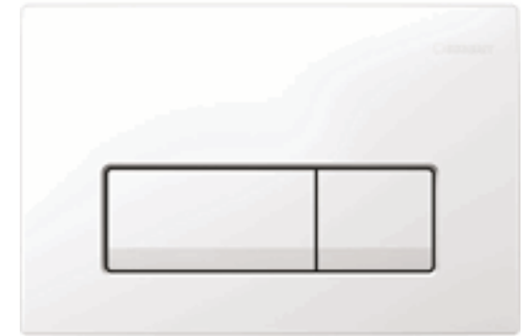
Geberit Bedieningspaneel Delta wit