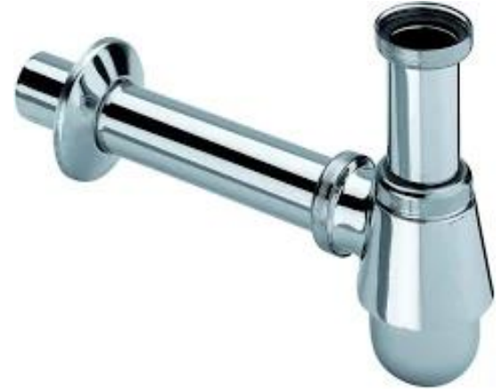
Viega Plugbekersifon met muurbuis en rozet, chroom