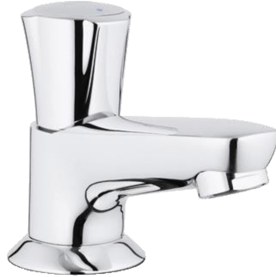
Grohe Fonteinkraan Costa