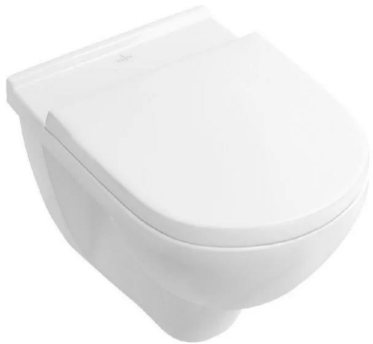
Villeroy & Boch Wandcloset o.novo, met zitting en deksel, wit