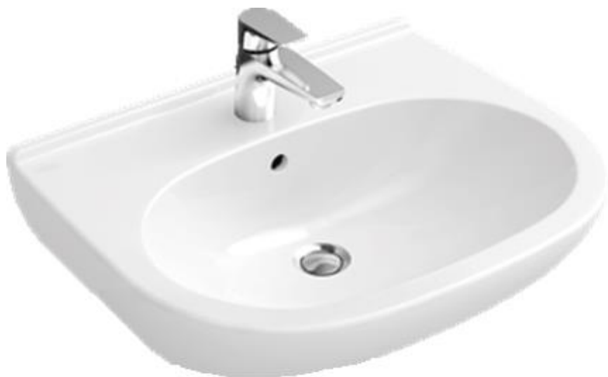
Villeroy & Boch Wastafel O.novo 60 x 49 cm wit met bekersifon met muurbuis met rozet chrom