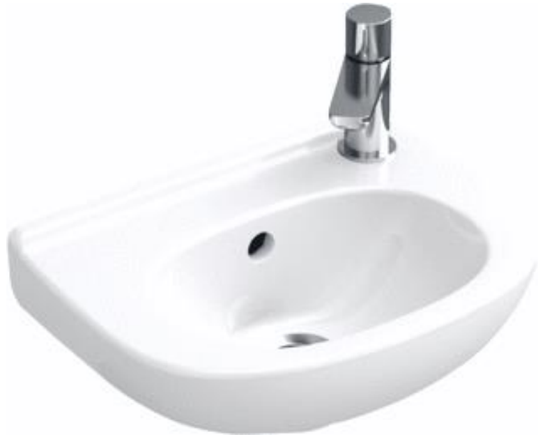
Villeroy & Boch Fontein O.novo 36cm x 25 cm wit