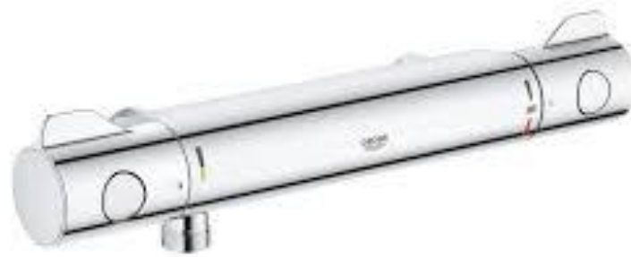
Grohe Thermostaatkraan 800 chromom