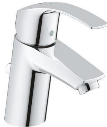
Grohe Wastafel mengkraan Eurosmart ES Zonder waste